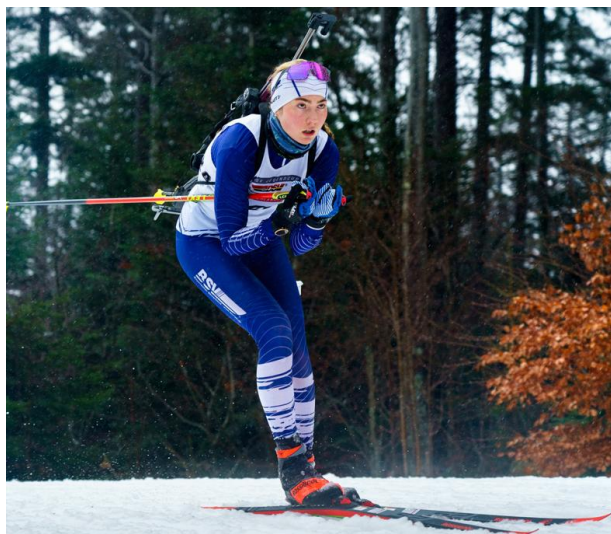
Juniorinnen